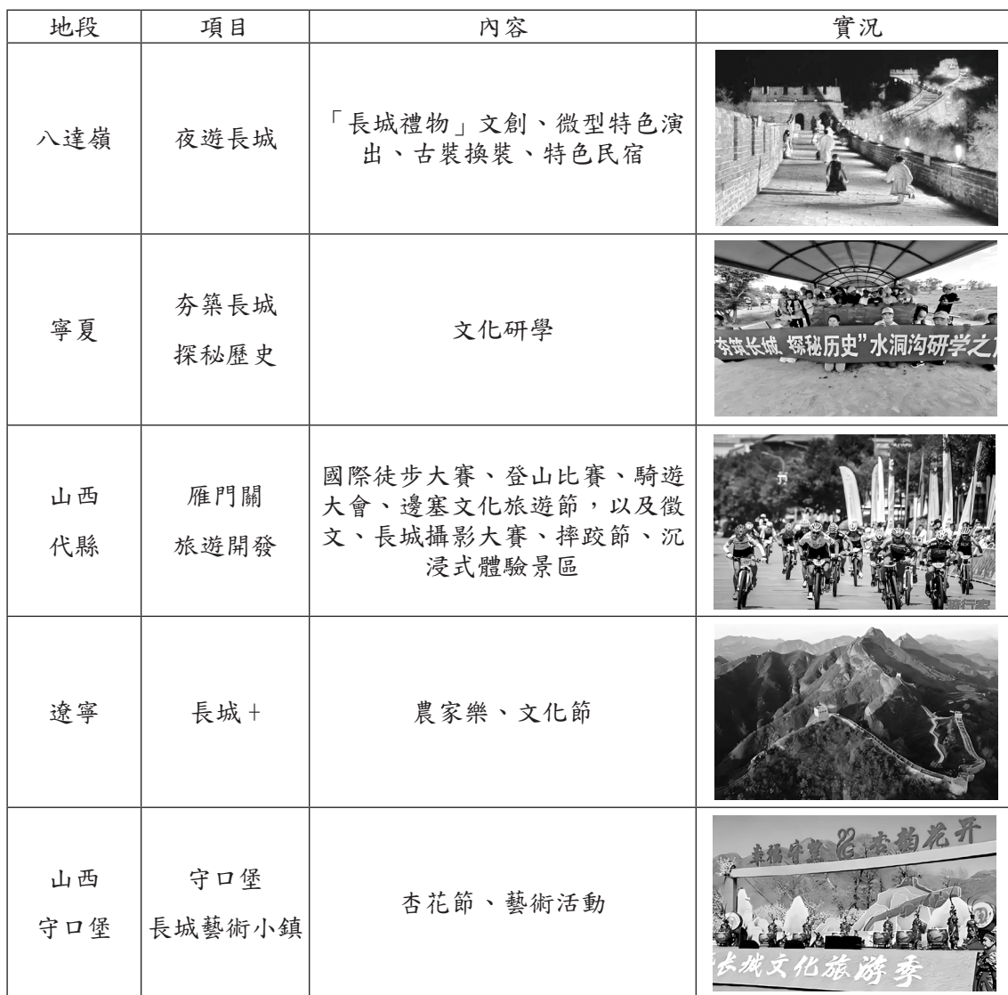
表 3：長城部分地段旅遊產業開發情況

長城沿線各地紛紛利用長城遺產帶的文化旅遊資源，結合自身優勢，因地制宜發展旅遊產業。山西大同的守口堡村，位於雲門山腳下，曾是明長城的重要防禦關口和屯兵之地，戰略意義重大。古長城在此蜿蜒起伏，被譽為「小八達嶺」。