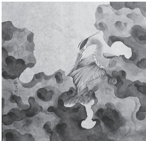
《愛羽》中山公園北美藍鷺