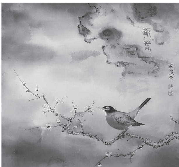
報春圖（美洲知更鳥）

遠在萬里之外的溫哥華有這麼一座讓我思鄉的園林，蘇式園林的亭台樓閣，粉牆黛瓦，泉石花木，讓我再一次有了為她創作的衝動。《愛羽》這件鳥與園林湖石的作品就孕育而生，其中的一個主角北美藍鷺正是園中的主角，每天都巡視在園中湖畔，在創作期間園方工作人員也提供了不少關於藍鷺的攝影