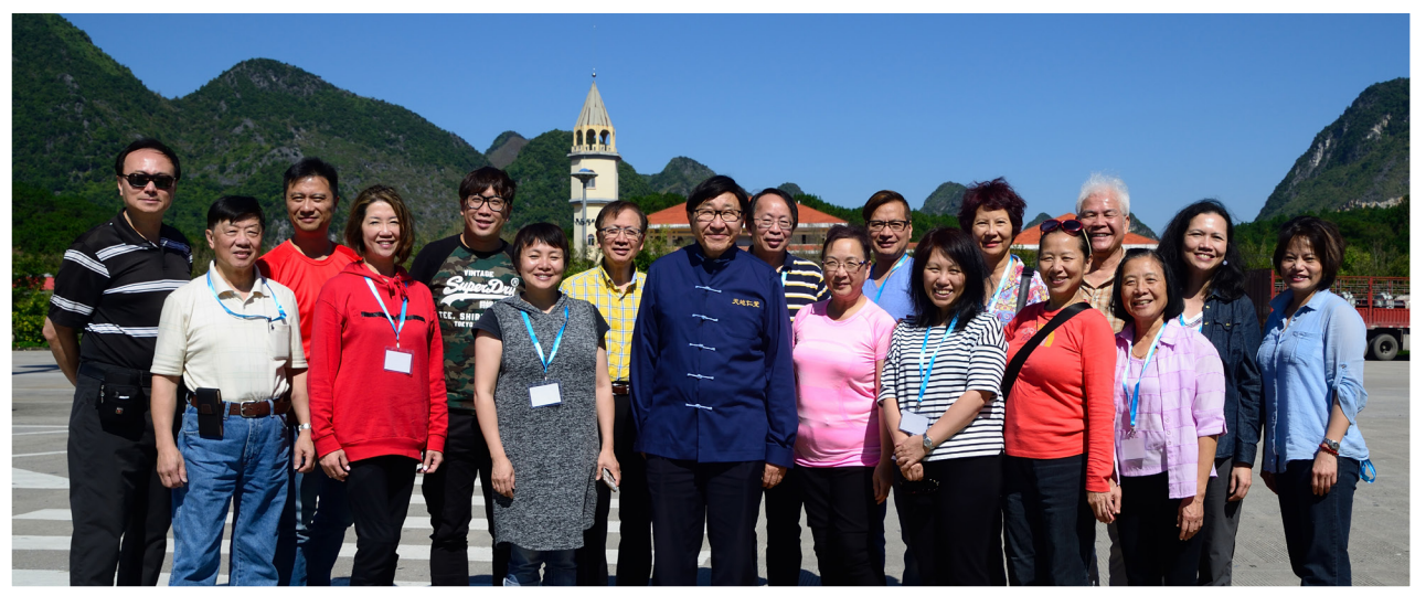
2018年廣西探訪隊員，疫情後文更將恢復探訪學生