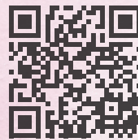
訂閱《文化中國》印刷版