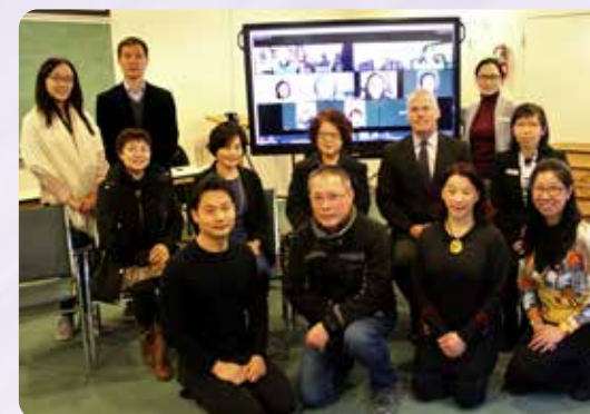
和學生們進行Zoom視像會面