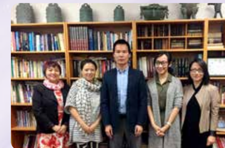
與學生在文更辦公室會面