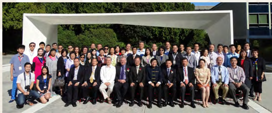
與會嘉賓工作人員大合照

由文化更新研究中心主辦的「文化中國學術年會」，於今年八月十二日至十三日在加拿大溫哥華的不列顛哥倫比亞大學（UBC）舉行，加拿大及香港兩地文更團隊通力合作，邀請到來自中國大陸、台灣、香港、澳門和北美等十三個城市近四十位學者的熱烈參與。加拿大三級政府、中華人民共和國駐溫哥華總領事館，和 Carey 學院代表均出席致賀。