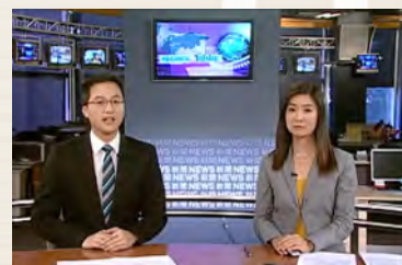
新時代電視 - 新聞報導