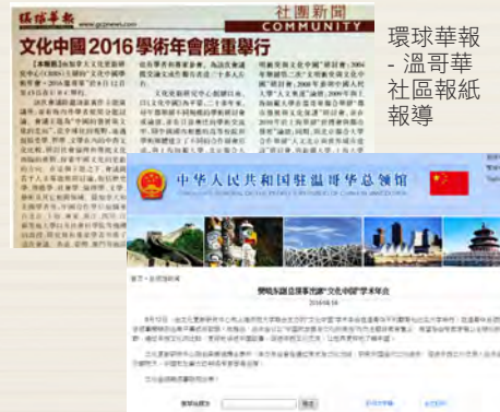
環球華報 - 溫哥華社區報紙報導